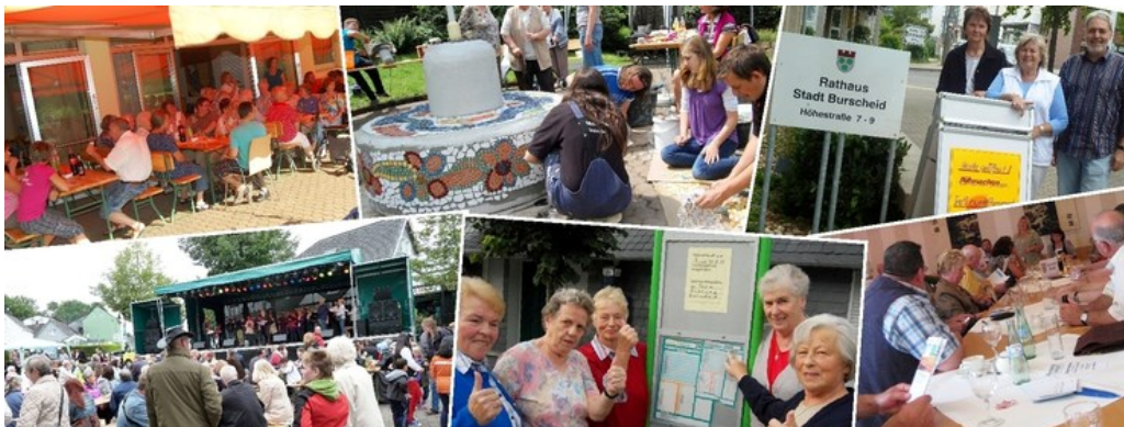
Projekte der Zukunftsinitiative Burscheid