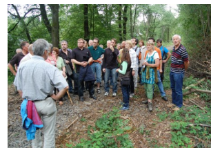
Burscheid - gehen und sehen